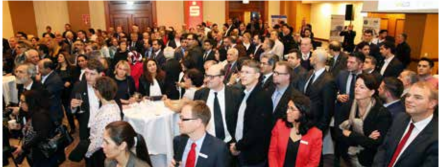
Salondan bir görünüm