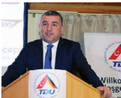
Ahmet Basar Sen, Generalkonsul der Türkei