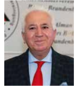
Hüsnü Özkanlı Generalsekretär