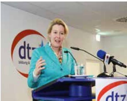
Bezirksbürgermeisterin Dr. Franziska Giffey