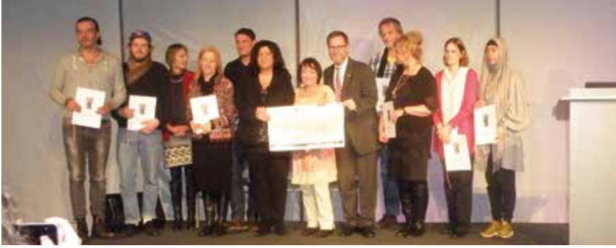
Tag der Migranten 2015 - In Charlottenburg wurde durch die Initiative des Bezirks 5000,-Euro für Flüchtlingsvereine gesammelt.

Geçen yıl yaz aylarından başlamak üzere savaştan ve yoksulluktan kaçarak Almanya'ya 1 Milyon'un üzerinde mülteci sığındı. İlçe Belediyeleri Berlin'e gelen mültecilerin kalacak yer bulma, bakım, yiyecek gibi temel ihtiyaçlarını karşıladılar ve karşılıyorlar. İlçeler içinde en fazla mülteciyi alan bir ilçe olarak Charlottenburg – Wilmersdorf İlçesi Belediye Başkanı Reinhard Naumann ile yaşanan zorluklar üzerine konuştuk.