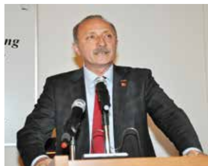
Ahmet Deniz Atabay, Bürgermeister von Didim