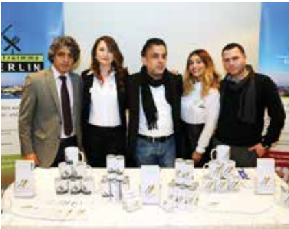
Gastro immo Berlin stantı