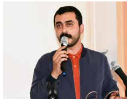
CHP-Abgeordnete Eren Erdem