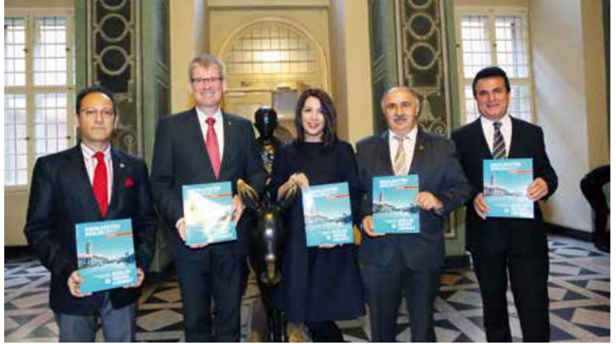
Konsolos Muavini Bülent Kılıç, Spandau Belediye Başkanı Helmut Kleebank, Baden-Württemberg, Eyaleti Uyum Bakanı Bilkay Öney, TDU Başkanı Remzi Kaplan, TDU Büro Müdürü Mümtaz Ergün

Belediye Başkanı, „Bundan böyle İlçemiz Spandau'dan çıkmış, burada büyümüş veya halen yaşayan göçmen kökenli insanların başarı hikayelerinden de örnekler verebileceğim için