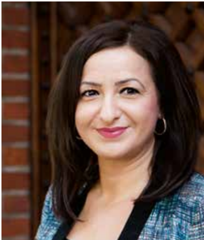
Dilek Kolat: Senatorin für Arbeit, Integration und Frauen

Vor kurzem war ich Gast bei einem ganz besonderen Tag für 17 junge Mitarbeiter der Berliner Stadtreinigung. Sie erhielten nach erfolgreicher Qualifizierung zum Straßenreiniger und Müllwerker ihre Arbeitsverträge. Ein junger Mann nach dem anderen trat stolz nach vorne, um seinen Vertrag entgegen zu nehmen. Die aufgerufenen Namen: deutsch, polnisch, türkisch, arabisch – sie klangen wie eine Begleitmusik zur Einwanderungsgeschichte Berlins in den vergangenen 50 Jahren.