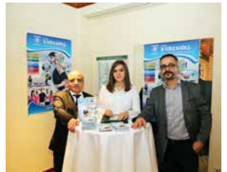
Evrensel Diş Kliniği stantı