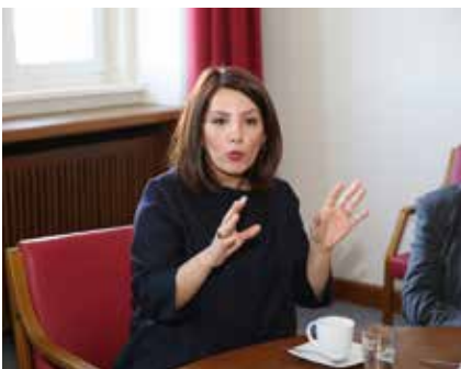
Bilkay Öney, Ministerin für Integration in Baden-Württemberg,