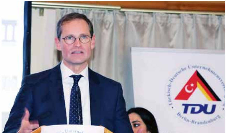
Michael Müller, Regierender Bürgermeister von Berlin