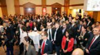
Neujahrsempfang der TDU mit großer Resonanz