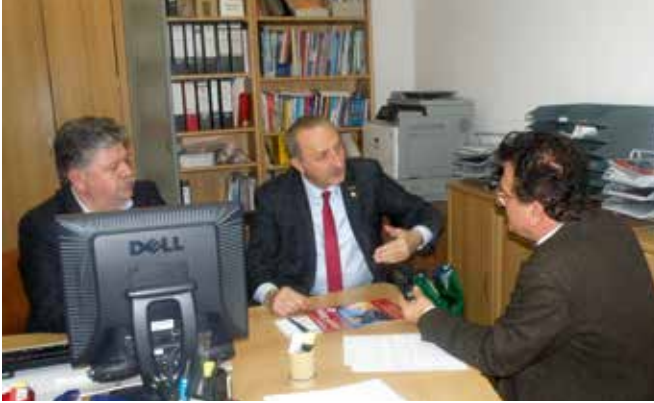
Ahmet Deniz Atabay, Didim Belediye Başkanı

Ekonomi Dergisi olarak Didim Belediye Başkanı Ahmet Deniz Atabay ile turizm sektöründe bu yıl yaşanan ve yaşanması beklenen sıkıntı üzerine bir söyleşi gerçekleştirdik. Ahmet Deniz Atabay turizm sektöründen gelme bir işadamı olarak ta, uzun yıllar Didim turizminin gelişmesi için, bir çok proje ve çalışma da aktif yer almış, öncülük etmiş bir Belediye Başkanıdır. Bu söyleşi Mart 2016 tarihinde yapıldı.