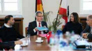
Berlin Meine Heimat - Spandau TDU-Publikation ist erschienen