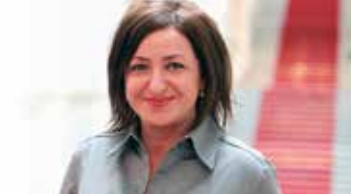
Dilek Kolat, Senatorin für Arbeit, Integration und Frauen Integration der Geflüchteten in den Arbeitsmarkt