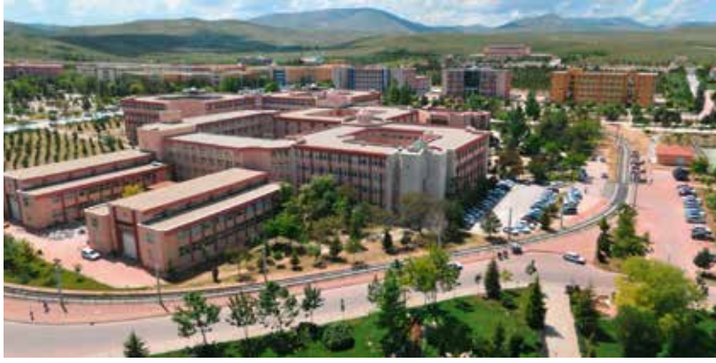
Selçuk Üniversitesi – Türkiye, Konya

sonra eşler nedeniyle ortaya çıkabilecek geçimsizlikler de sorun yaratabilmektedir. Çocuklarınız başka bir şirkette en az 3 yıl çalışsın, en az iki terfi alsın. Çocuklarınızın acemilik dönemlerinde sizi, şirketinizi yok etmelerine izin, yol vermeyin. Türkiye'de veriler, 4. Kuşağa ulaşabilmiş aile şirketi oranının yüzde 6'yı geçmediğini göstermektedir. Aile şirketlerinde çıkan