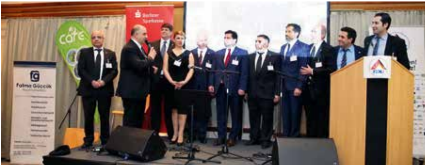
TDU Yönetim Kurulu

Ekonomi, Teknoloji ve Araştırma Senatörü bayan Cornelia Yzer 20. Kuruluş Yıldönümü nedeniyle TDU'yu kutlayarak başladığı konuşmasında, Berlin'in son yıllarda kaydettiği ekonomik başarıları dile getirdi. "Berlin Avrupa düzeyinde güçlü bir metropol ve dinamik bir ekonomik yer haline geldi. Haritada teknoloji