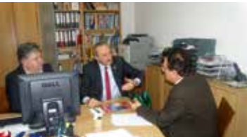
Gespräch mit dem Bürgermeister von Didim Deniz Atabay über den Türkei-Tourismus